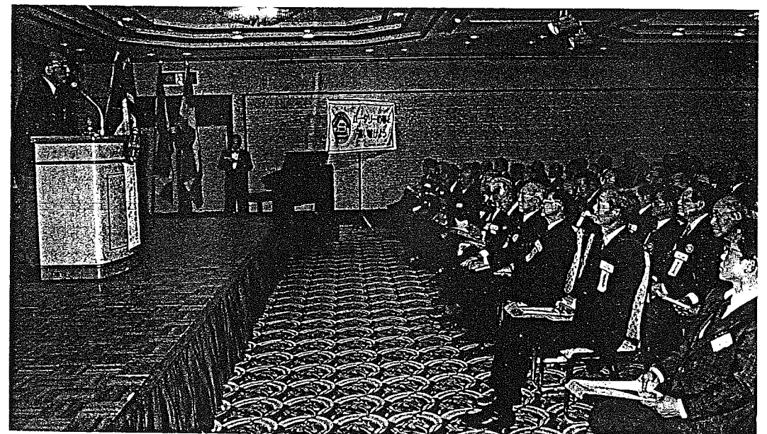
▼ユーモア一杯の基調公演。神戸PG