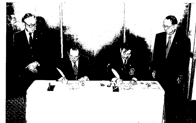
両地区統合調印式 懸田ガバナー 白倉ガバナー

同会場において両地区出席者全員の見守る中で懸田利孝ガバナー（2810地区）、白倉義則ガバナー（2520地区）による両地区統合合意文書に署名調印式を行った。